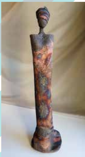
LYNE LANGLOTTI CÉRAMISTE-PLASTICIENNE