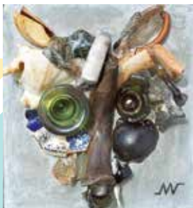
MURIEL VERDEROSA PLASTICIENNE