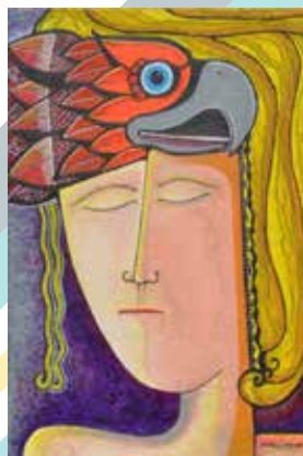
MICHEL PHILIPPON PEINTRE-PLASTICIEN