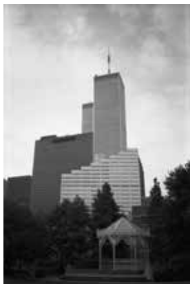
ANDREW HAY MACCONNELL PHOTOGRAPHE DE RUE